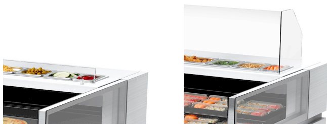
Laag of hoog glaspaneel vóór ingrediënten