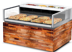
Aanpasbare beplating en materialen