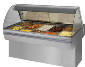
Hot Deli 5 Curved Full-Serve