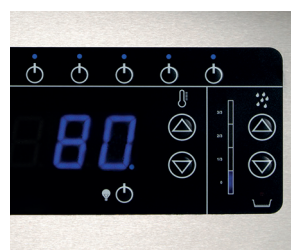
Bedieningspaneel van Premium