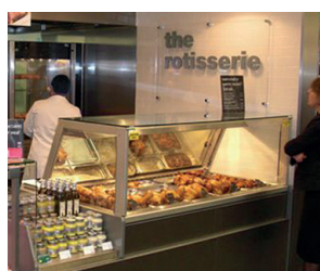
Hot Deli Square