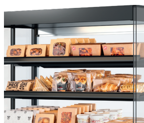
Voedsel (letterlijk) in de spotlights - Ledverlichting boven elk schap.