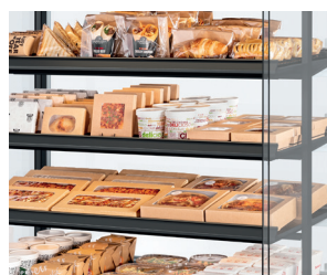
Ultieme productzichtbaarheid - transparant ontwerp, dunne schappen, geen afleiding.